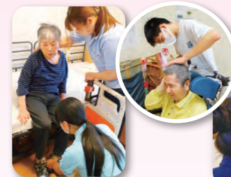
三重県立伊賀白鳳高等学校の生徒さんが介護実習に来て下さいました!! 入居者様にも、職員にも良い刺激となりました。また来て下さいね。