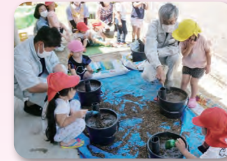
JAIがふるさとさんにバケツ田植えを教してもらったよ。秋にたくさんのお米が収穫できるの楽しみだね♪