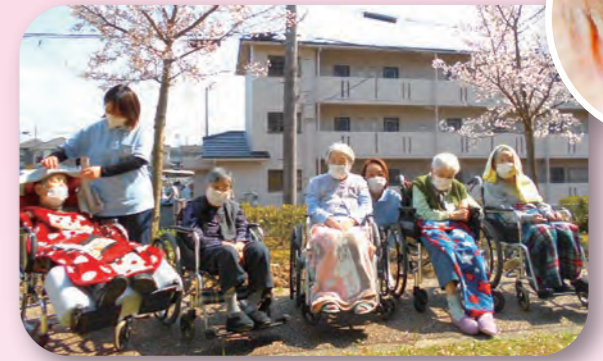
今年で10年目を迎える施設の桜とパシャリ。まだまだ若いなあ～