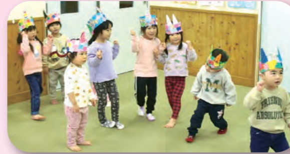
「鬼のパンツ」の歌に合わせてダンスタイム♪