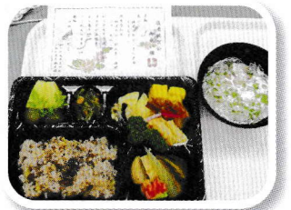
昼食は豪華なお祝い膳です。