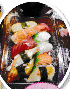
お寿司 盛り合わせ