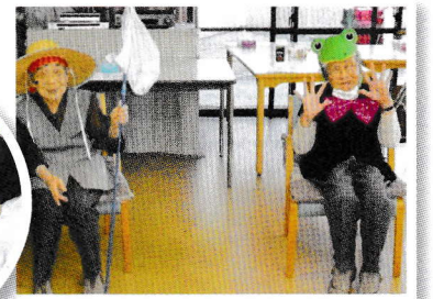
仮装タイム 笑顔がチャームングです。