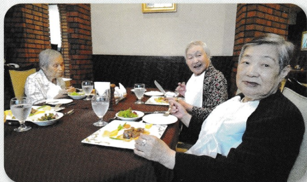
金谷でちょっとリッチにステーキランチ!