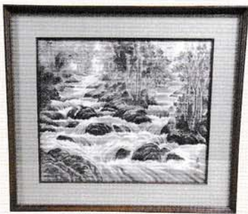
▲作:福尾 卓彌「奥入瀬溪流」