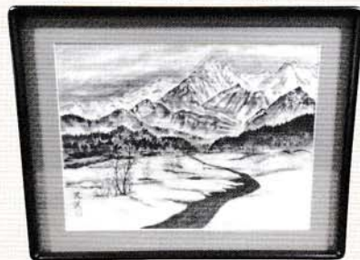
▼作:金子 諭「白馬連山」