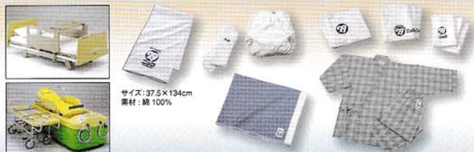
サイズ: 37.5 × 134cm 素材: 綿 100%

豊かな高齢社会に向けて、レンタルオシメのほか、リネンサプライヤーとして多様なリースアイテムをご提案、さらに介護用品や医療・福祉機器の販売など多彩なサービスで介護をサポートします。